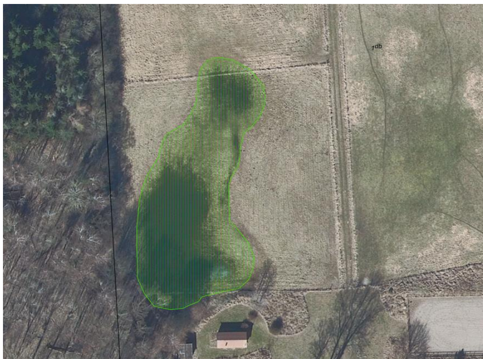
Figur 6: Luftfoto fra 2021, med det opmålte engareal på 2323 m 2 skraveret med grønt.

Det vurderes, at de 4 år hvor en større del af lavningen har været fugtig, er for kort tid til at engvegetationen er omfattet af naturbeskyttelsesloven. Normal praksis er at det tager minimum syv år efter et areal tages ud af drift at udvikle eng omfattet af naturbeskyttelsesloven. Det vurderes dog stadig, at den tilstødende fugtige lavning så vidt muligt skal bevares for, at sikre den som rasteområde for padderne når de går på land. Derfor bør opgravet materialer ikke placeres i den del af lavningen der ikke udgraves til søen, men derimod placeres på et af de omkringliggende arealer uden for lavningen.