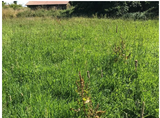
Figur 5: Foto fra besigtigelsen den 11. juli

Engarealet er ved hjælp af opmålinger fra besigtigelsen den 11. juli samt højdekurver og gennemgang af luftfotos opmålt til at have et areal på ca. 2300 m 2 , og opfylder dermed ikke størrelseskravet på 2500 m 2 for at være beskyttet efter naturbeskyttelseslovens § 3. Ydermere kan det ses på luftfotos, at et større område af lavningen først begyndte at blive fugtigt i 2019. Inden da har kun en meget lille del på ca. 400 m 2 været periodevis fugtigt sidst i 2016 og igen i 2018. Den resterende del af lavningen og de omkringliggende områder fremstår som tør.