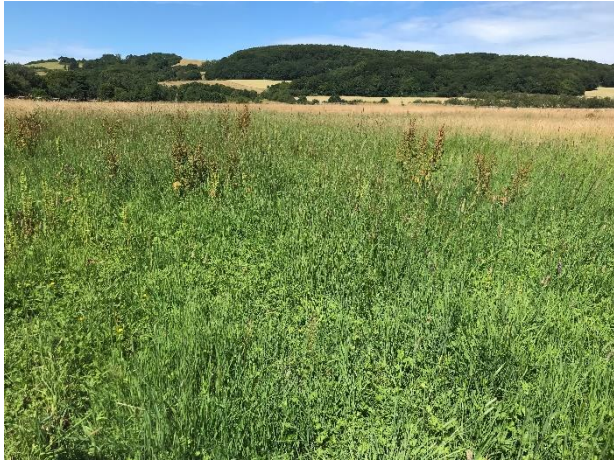
Figur 4: Foto fra besigtigelsen den 11. juli