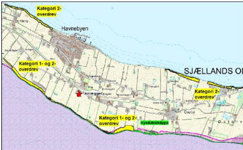
Figur 2. Anlæggets beliggenhed i forhold til Natura 2000, Kategori 1-natur og Kategori 2-natur. Natura 2000 og kortlagt habitatnatur er vist med hhv. gult, lilla skravering og grønt.