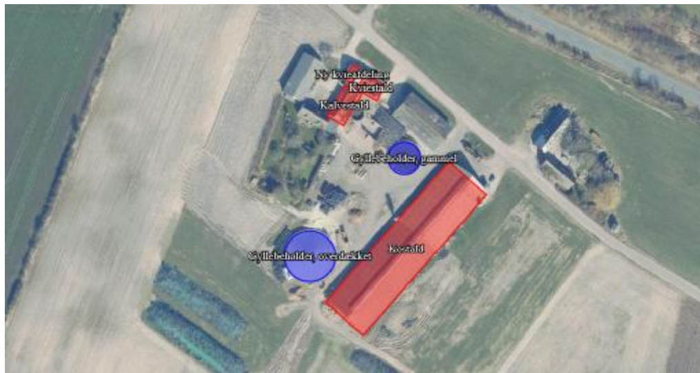
Figur 1. Husdyrbrugets ansøgte projekt med stalde (rød) og gødningsopbevaringsanlæg (blå)

Placering af stalde og gyllebeholdere mv. fremgår af figur 1 herunder samt situationsplanen i bilag 1.