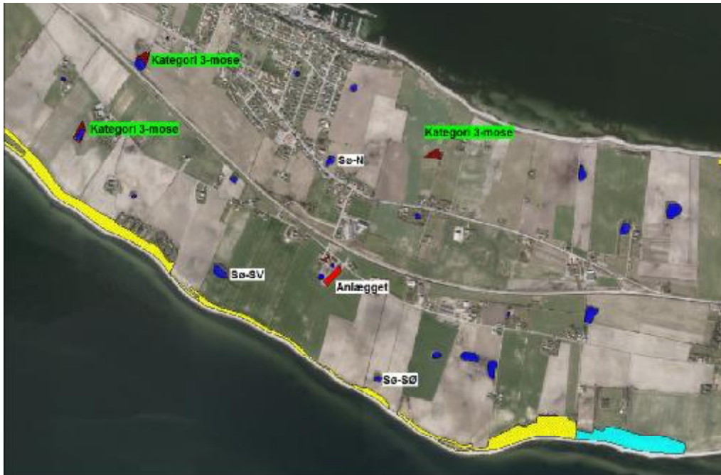
Figur 3. § 3-omfattet natur omkring anlægget. Søer, moser, overdrev og strandenge er angivet med hhv. blå, brunt, gult og turkist.