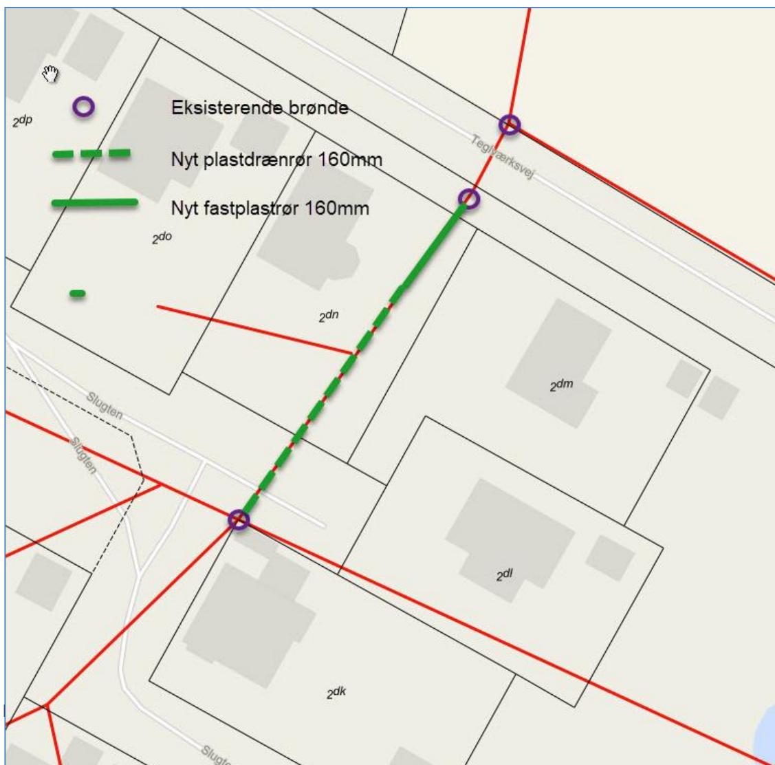
Figur 1 Oversigtskort fra ansøgningen. Projektområde er vist med grønt.

Den øvrige strækning ca. 32 meter, skiftes til plastdrænrør Ø160 mm. Se figur 1.