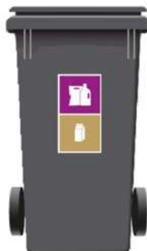
240 L 1-rum