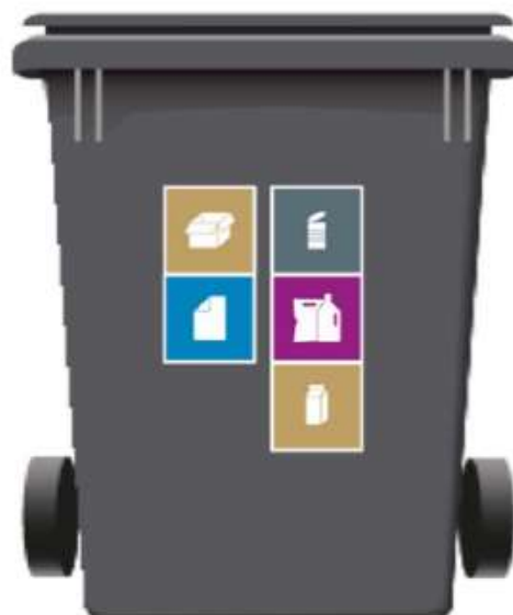
370 L 2-rum