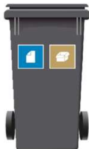
240 L 2-rum