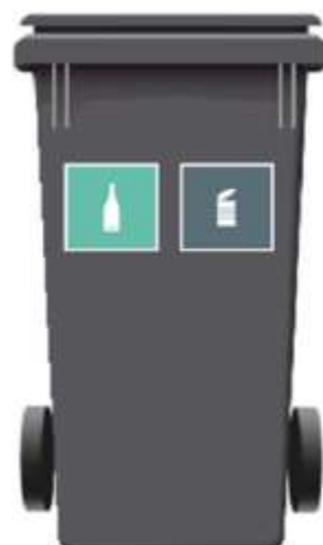
240 L 2-rum

FLERE BEHOLDERE OG FÆRRE SAMMENBLANDINGER INKL. UDSKIFTNING AF EKSISTERENDE AVIS/METAL VED HELÅRS